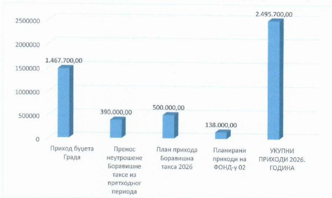
Графикон 2: Учесће укупним приходима ЈУ Туристичка организација града Бања Лука

Усвојеним буџетом за 2025.годину план боравишне таксе ранијег периода у износу од 345.680,00 KM је реалан износ средстава који је остао од боравишне таксе ранијих године. Од укупног износа 345.680,00 KM одбија се извршење на дан 31.12.2025.године у износу од 282.052,39 KM, од чега остаје неутрошено средстава из ранијих године 2024. и раниј, у износу од 63.627,61 KM.